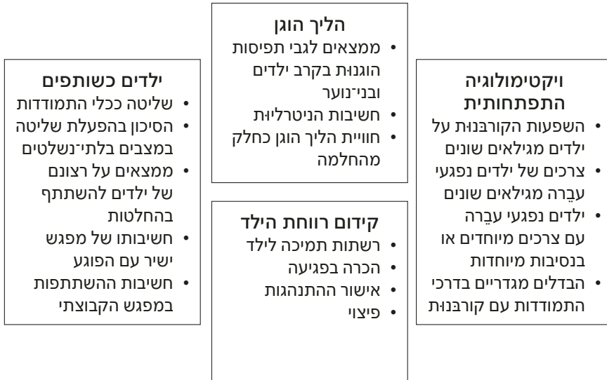
איור 2: מודל צרכים־זכויות לילדים נפגעי עברה – הרובד האמפירי

במושג "ילדים כשותפים". מקבילתו של עקרון טובת הילד היא רווחתו. זיהוי המקבילה המשפטית למינוח ממדעי החברה מאפשר למצוא נקודות ממשק מהותיות בין עולם המציאות לבין עולם הזכויות של ילדים נפגעי עברה. בעזרת ההכוונה שהרובד הנורמטיבי מספק, המודל ממפה, מסווג וממייין את הממצאים הפסיכו־סוציאליים לארבעה תחומים המתקשרים להליך הפלילי (ראו איור 2).